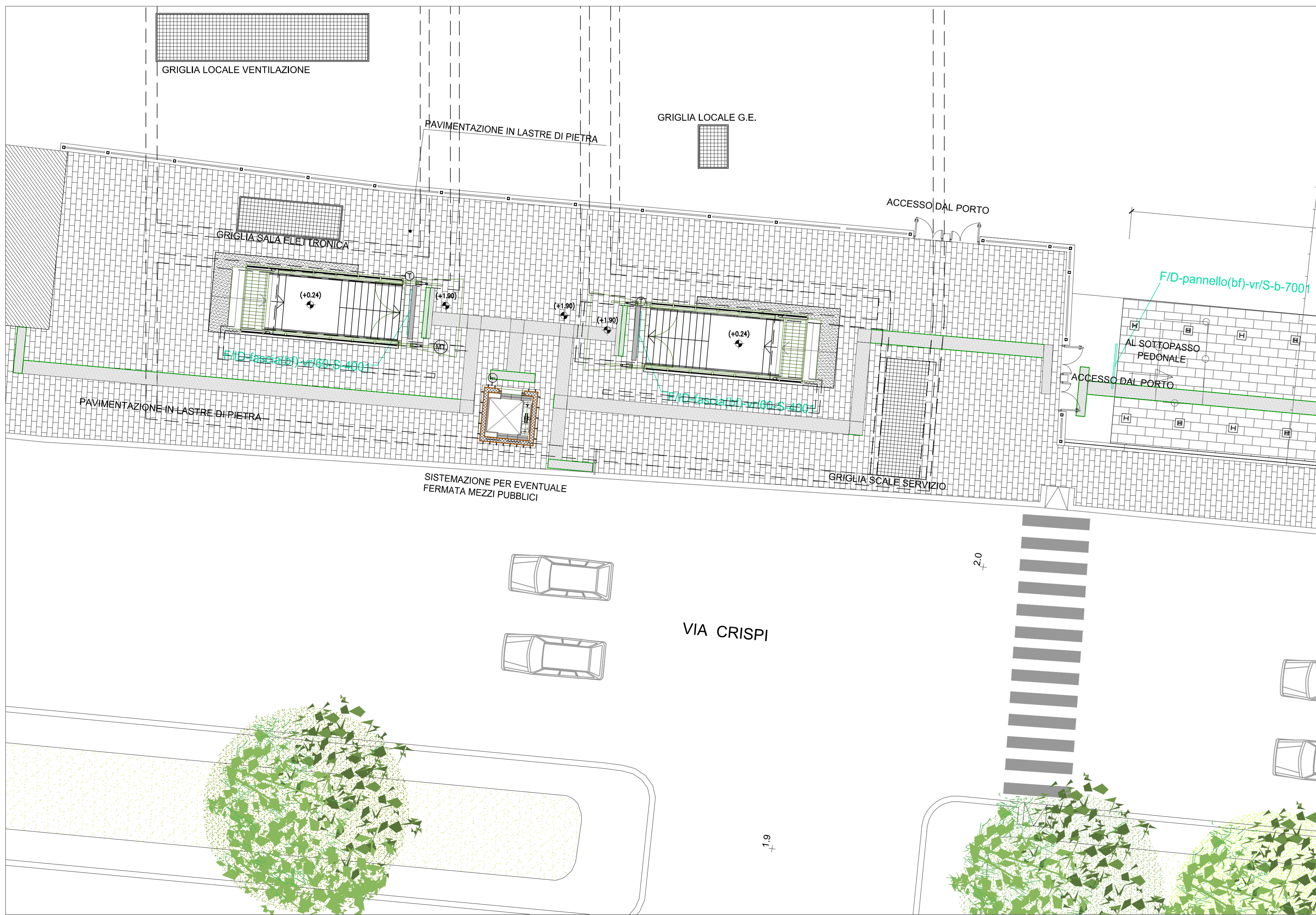
PIANTA LIVELLO ACCESSI scala 1:100