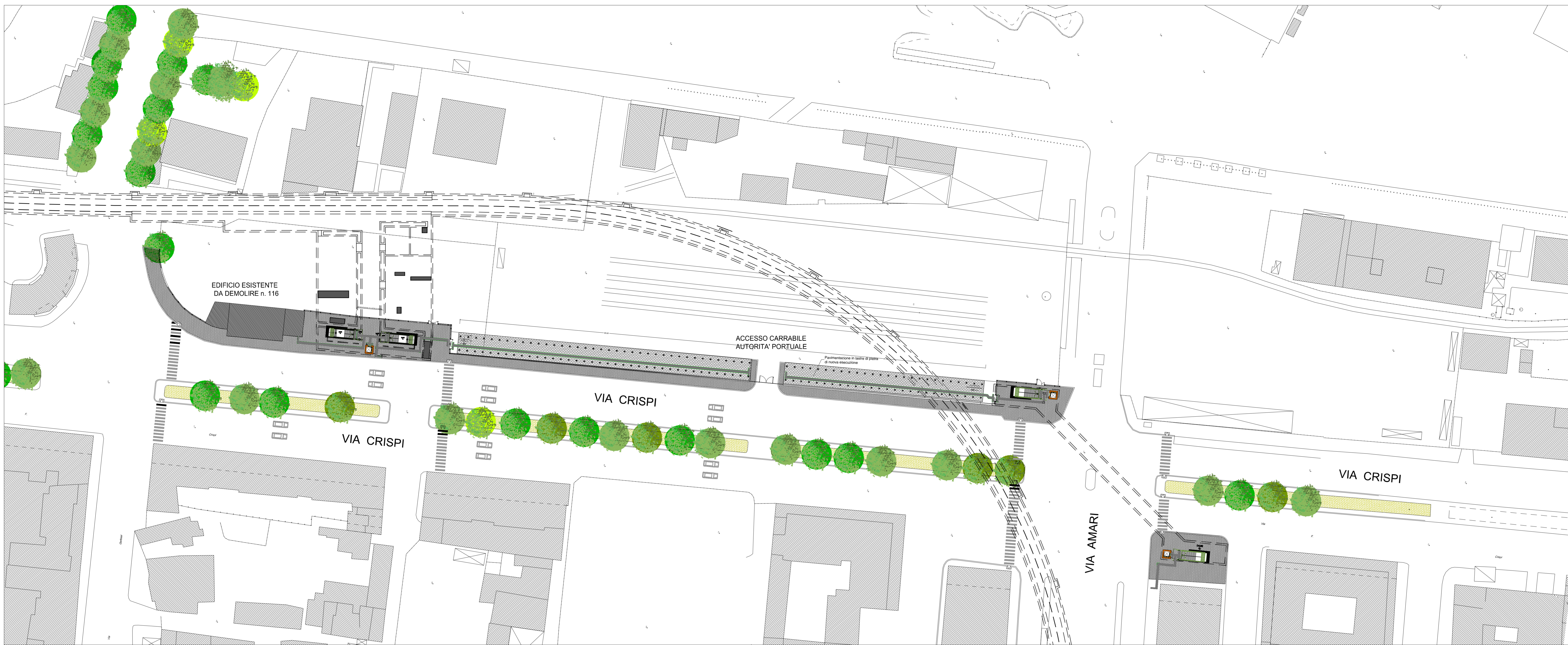
PIANTA LIVELLO ACCESSI scala 1:500