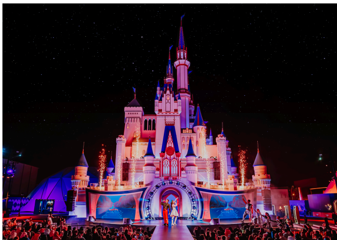
Disney: The Castle - Riyadh 2023