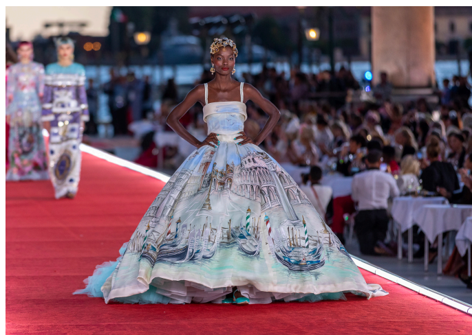
Dolce & Gabbana Alta Moda - Venezia 2021

La divisione vanta un'esperienza di alto livello nell'ideazione e produzione di esperienze di brand di lusso, tra cui Louis Vuitton, Formula 1, Ferrari, Dolce & Gabbana, MSC, Buccellati, Maserati, Bulgari, IWC, Azimut Benetti e molti altri.