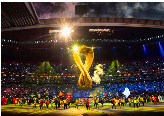
Cerimonia d'apertura FIFA World Cup - Doha 2022

raccontano l'esperienza finale della produzione artistica. Balich Wonder Studio vanta il primato di aver ideato e prodotto il maggior numero di Cerimonie Olimpiche e una serie di altri eventi esclusivi per i marchi più prestigiosi del mondo. Fonde i talenti e le competenze di un team multiculturale di oltre 280 persone provenienti da 20 Paesi e opera attraverso due società in Medio Oriente e quattro business units: