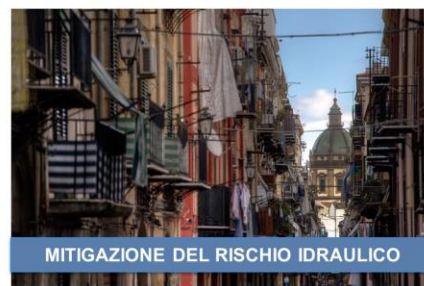
MITIGAZIONE DEL RISCHIO IDRAULICO